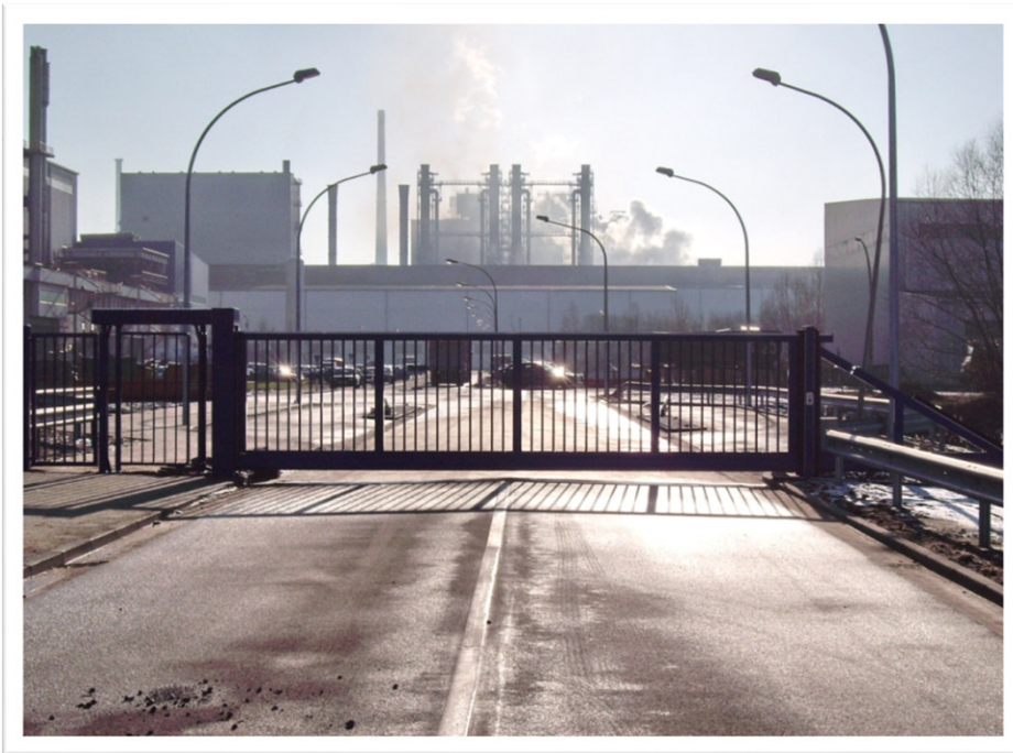
Impressionen bei Arcelor Mittal Werk Bremen