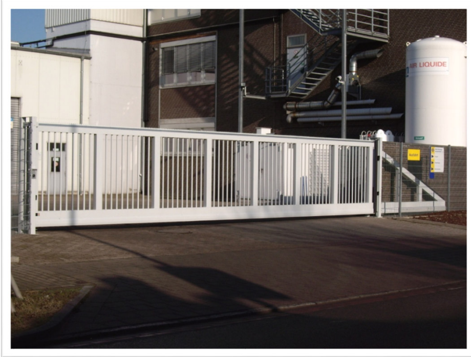
Schiebetor 12,00 x2,00 m Werksausfahrt Hella Bremen